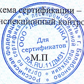
Схема сертификации – 1с(м). Инспекционный контроль – октябрь 2023 года, октябрь 2024 года.