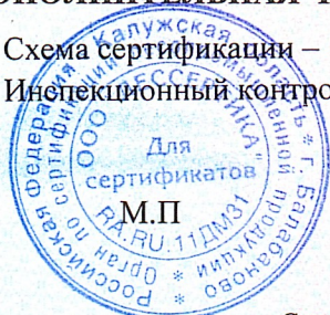
Схема сертификации – 1с(м). Инспекционный контроль – август 2024 года, август 2025 года.